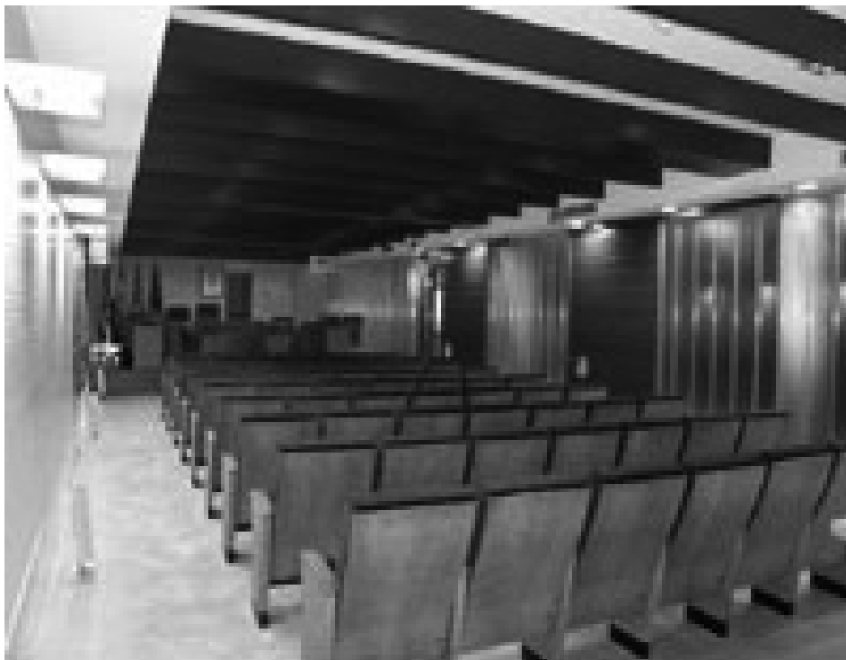
El PP desvirtúa el fin de los Plenos Municipales negándose a debatir con la Oposición

Curiosamente les viene a sacar del pozo dónde se han metido