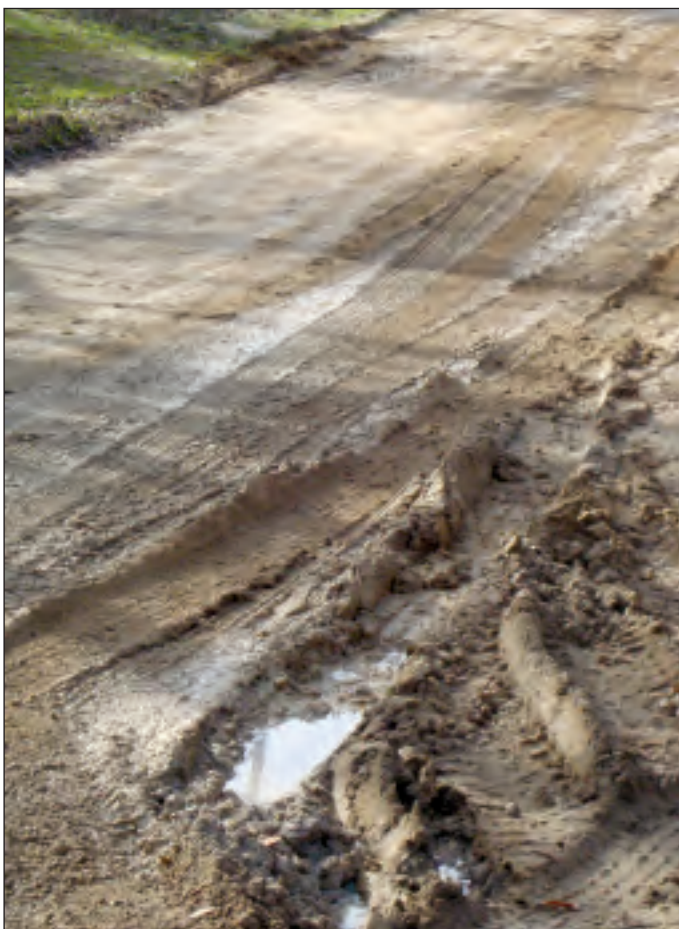
Carril de las Charcas