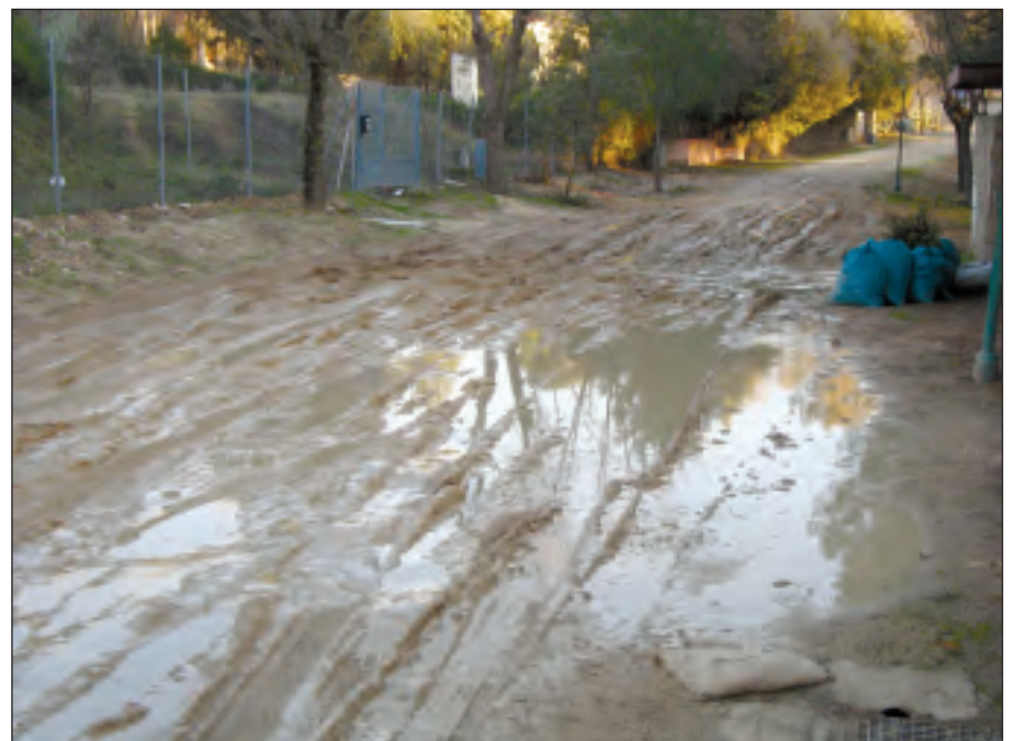
Carril de la Perdiz

AGRUPACIÓN SOCIALISTA DE SEVILLA LA NUEVA