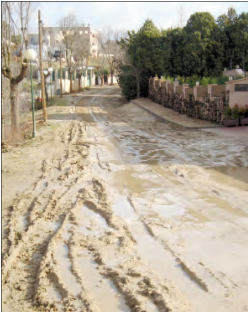
Carril del Valle

Estado en que quedaron algunas calles de "Los Cortijos" tras las últimas precipitaciones de lluvia y nieve y para las que urge dar una solución definitiva