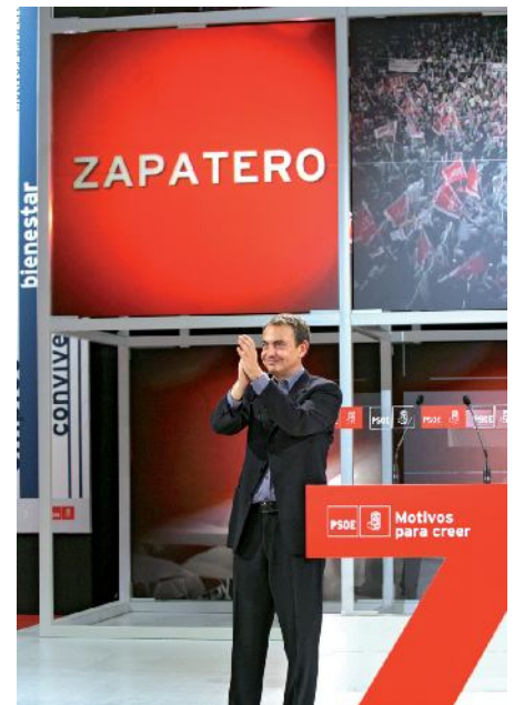
Sobran "motivos para creer" en los socialistas.