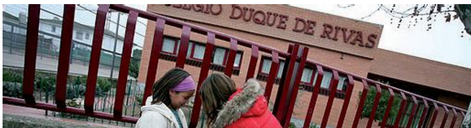
La Escuela Pública de Sevilla la Nueva no es un modelo al gusto de los Populares.

El Alcalde ante las necesidades educativas planteadas en el municipio ha optado claramente por potenciar y desarrollar la educación privada mediante la creación de un colegio privado concertado de línea tres en una parcela municipal sita en el SAU 6, junto al parque "El Olivar".